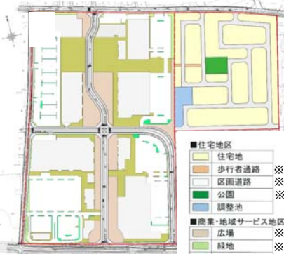
※は地区施設に定めるもの